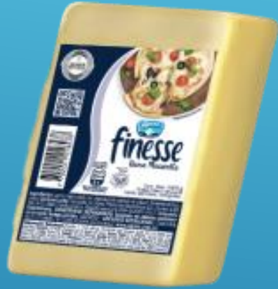
Finesse 1000 g