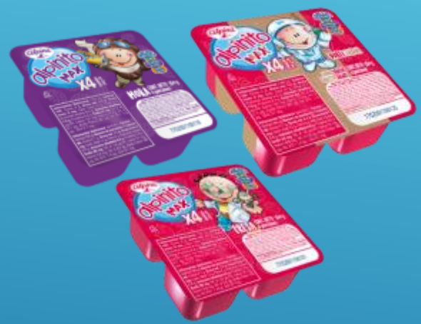
Frutos Rojos x4 Und 360 g