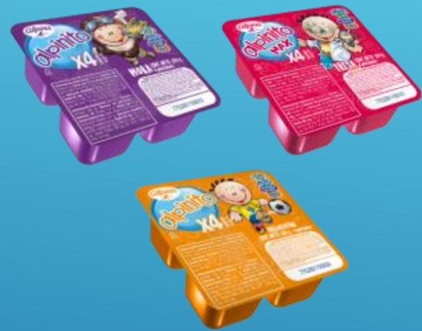
Fresa x4 Und 360 g