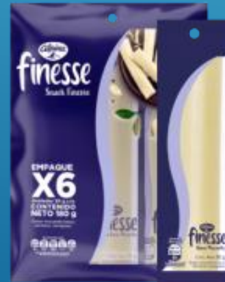
Snack x6 Und 180 g