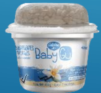
Vainilla y Cereal 105 g