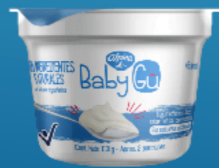
Natural 113 g