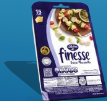
Finesse x15 Und 239 g