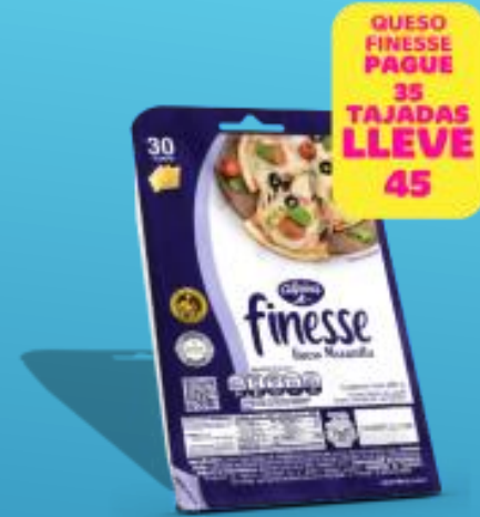
Finesse x30 Und 675 g