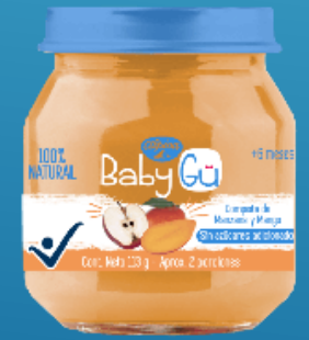
Mango y Manzana 113 g