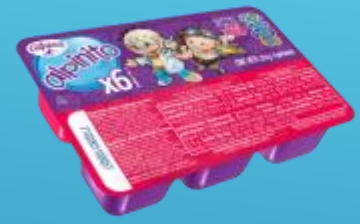
Fresa y Mora x6 Und 270 g