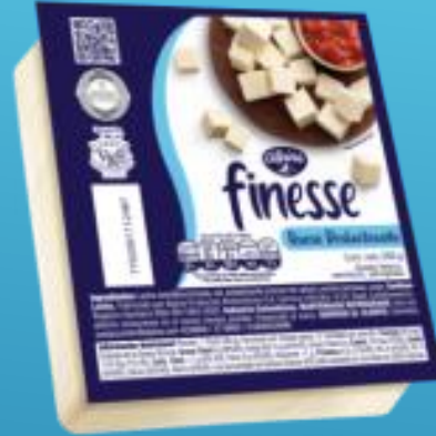
Deslactosado 250 g